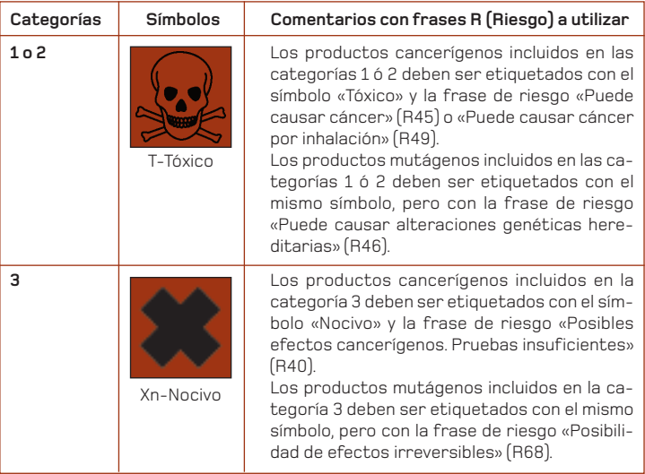
Cuadro 3 Etiquetado de las sustancias cancerígenas o mutágenas

La legislación europea estipula, por otro lado, que la empresa debe informar a sus trabajadores sobre los riesgos sanitarios que pueden suponer las sustancias que se encuentran en el lugar de trabajo y garantizar su formación con el objeto de reducir al mínimo los riesgos.